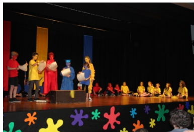
die Lösung liegt nicht in den Rollen