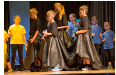
Univa bedroht Kolora