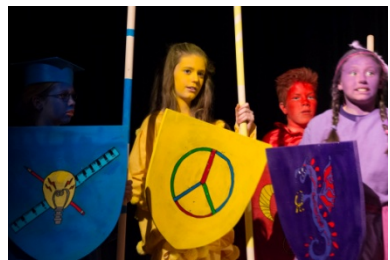
alle Proben sind bestanden