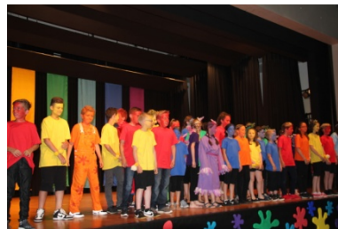
Lisblu wurde gefunden und Univa vertrieben