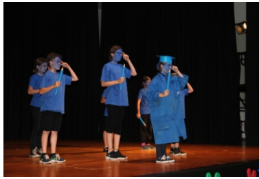
die intelligenten Asul