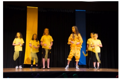
die lockeren Tschalli