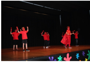
die starken Rochos